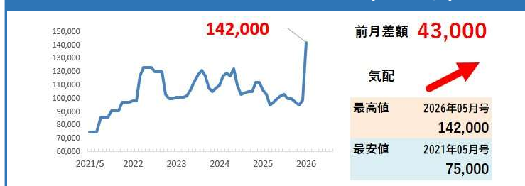
ストレートアスファルト 針入度60～80 ローリー (単位：円/t)